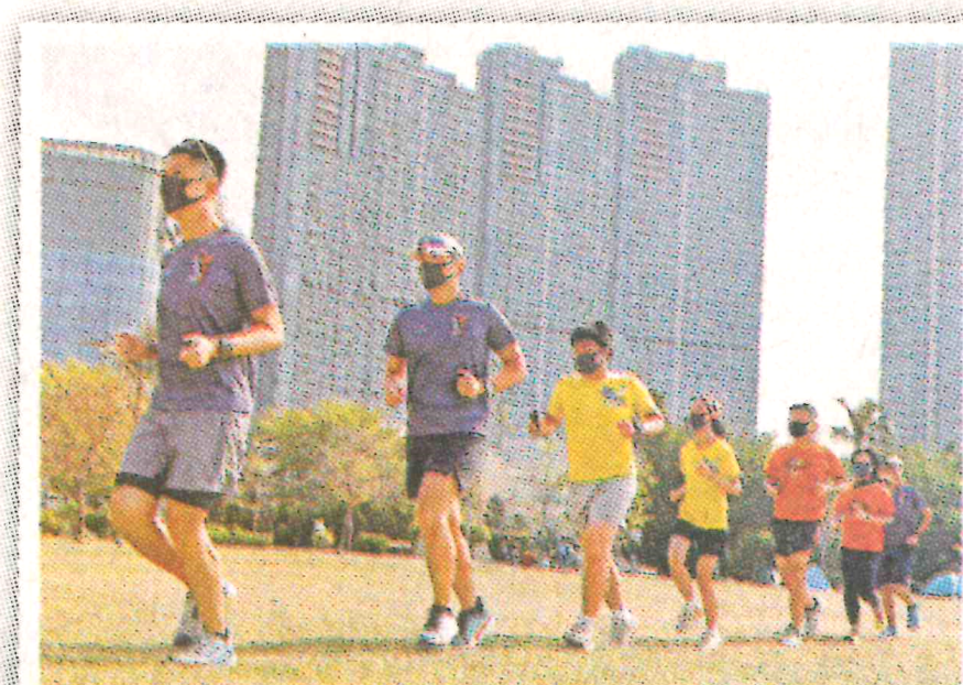
■ 師生們展開3日2夜「Staycation Run」，跑足45公里。