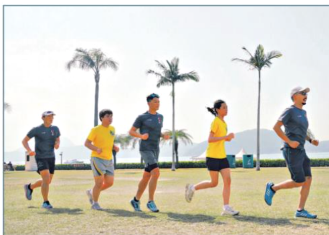
東華三院黃鳳翎中學2017年創立長跑隊，希望幫助操行、能力和學習動機較弱的學生建立自信。

長跑步；但希望幫助操行、能力和學習動機較弱的學生，從跑步訓練建立自信和堅毅精神。駐校社工壽振飛則盼學生參與長跑時放下手機，學懂欣賞風景，並找回自我認同。