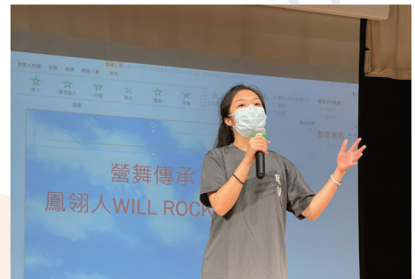
在中一迎新營中帶領師弟妹表演