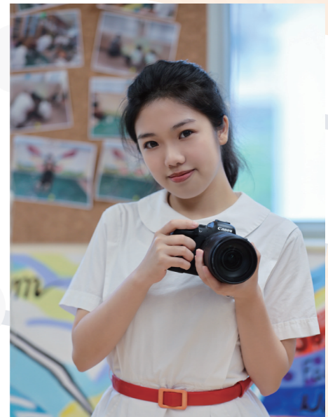
除了跳舞，攝影也是我的興趣