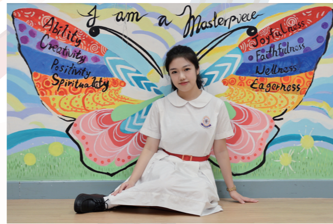
追求繽紛和沒有設限的人生

晟環：老師們令我明白到「 人生不只是一種生活方式 」、是可以有不同的專長、興趣，人生可以很豐富的。