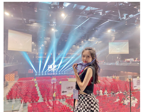
跳舞令我成長和喜樂