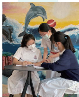
一起努力，向夢想進發