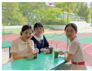
一起喝奶茶的開心日子